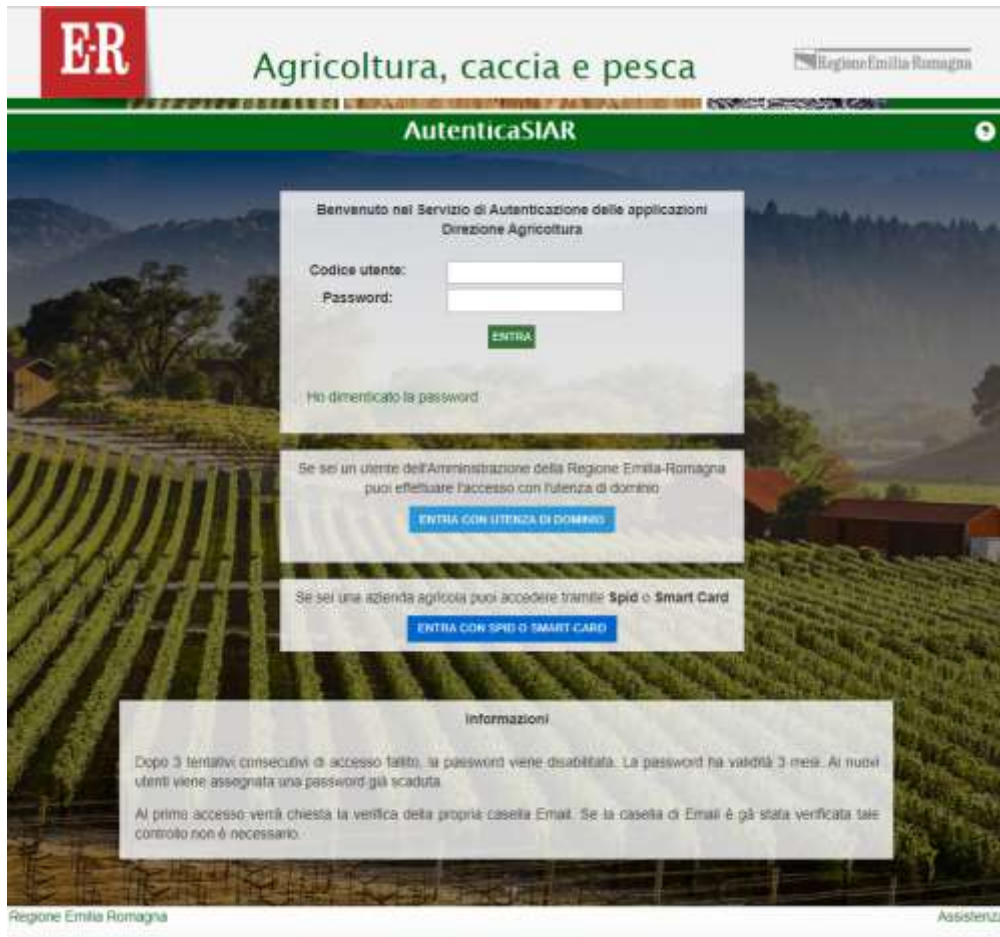
Figura 1: pagina di accesso unificato del Sistema Informativo Agricolo Regionale

Accedendo all'applicazione su cui lavori quotidianamente sarai automaticamente inoltrato alla nuova pagina di accesso unificato del Sistema Informativo Agricolo Regionale (SIAR) della Regione Emilia-Romagna: AutenticaSIAR.