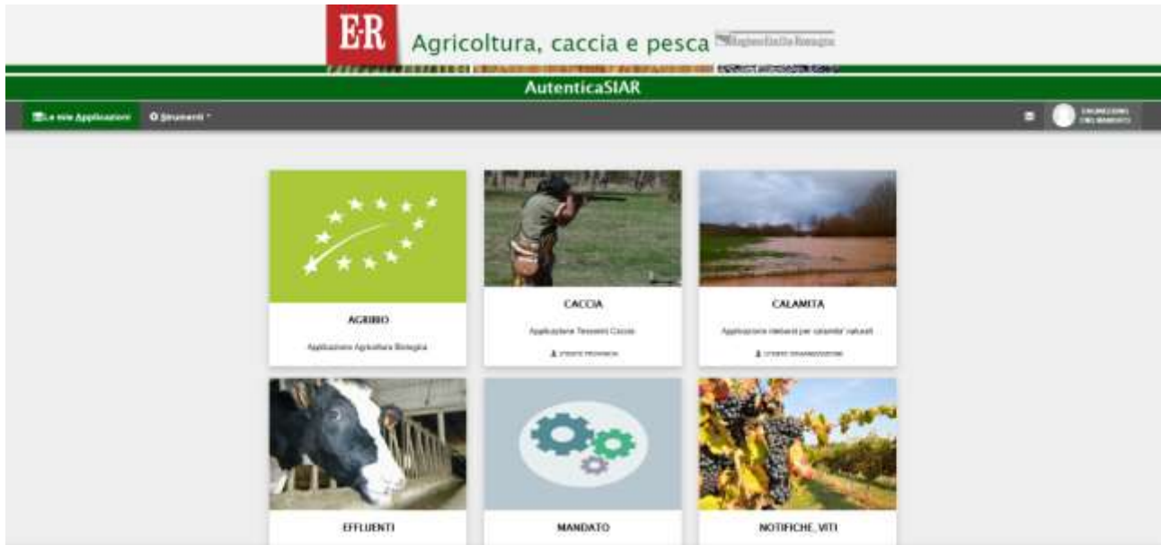
Figura 5: pagina "Le mie Applicazioni"

Quando accedi vedi la pagina Le mie applicazioni. In questa pagina trovi le applicazioni del SIAR a cui sei stato autorizzato; premi su una di esse per entrarvi.