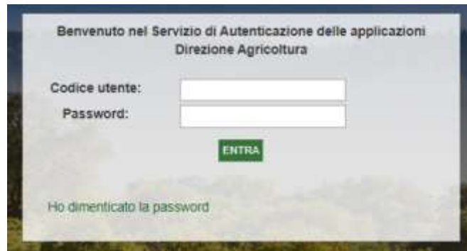
Figura 2: accesso con credenziali Codice utente e password