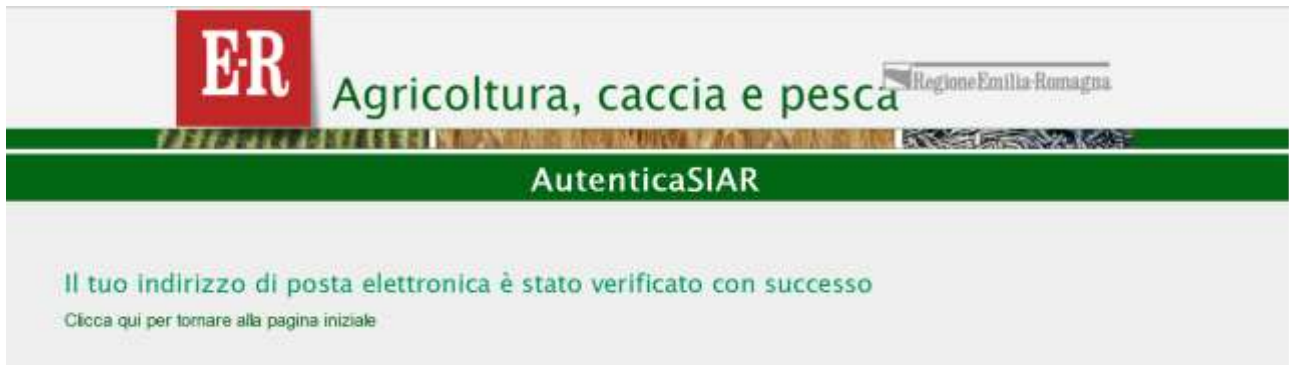
Figura 11: messaggio indirizzo e-mail confermato con successo

Se la procedura di verifica indirizzo e-mail termina con successo allora sarai completamente autonomo nel crearti una nuova password (vedi sezione 4 Recupero password).