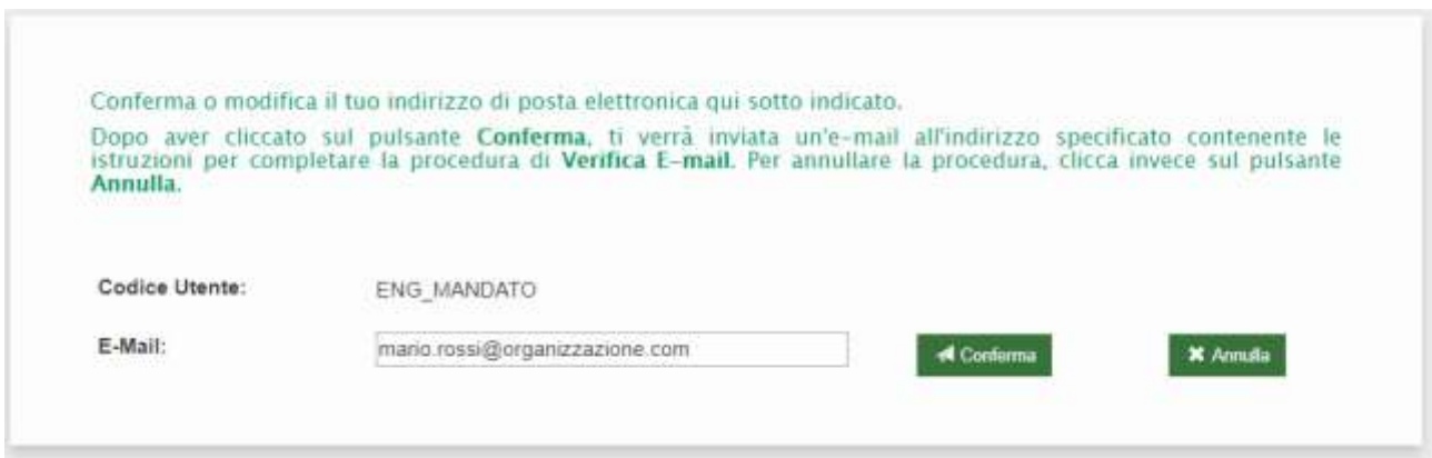
Figura 10: conferma indirizzo e-mail

Selezionando il tasto Verifica E-mail ti verrà presentato l'eventuale indirizzo e-mail già in possesso dal sistema.