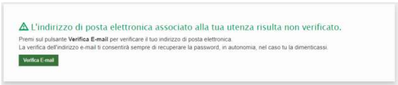
Figura 9: messaggio di verifica e-mail

Tipicamente, quando non hai fornito un indirizzo e-mail, oppure quando lo hai fornito ma non lo hai ancora verificato, accade che il sistema ti visualizzi il messaggio di verifica e-mail.